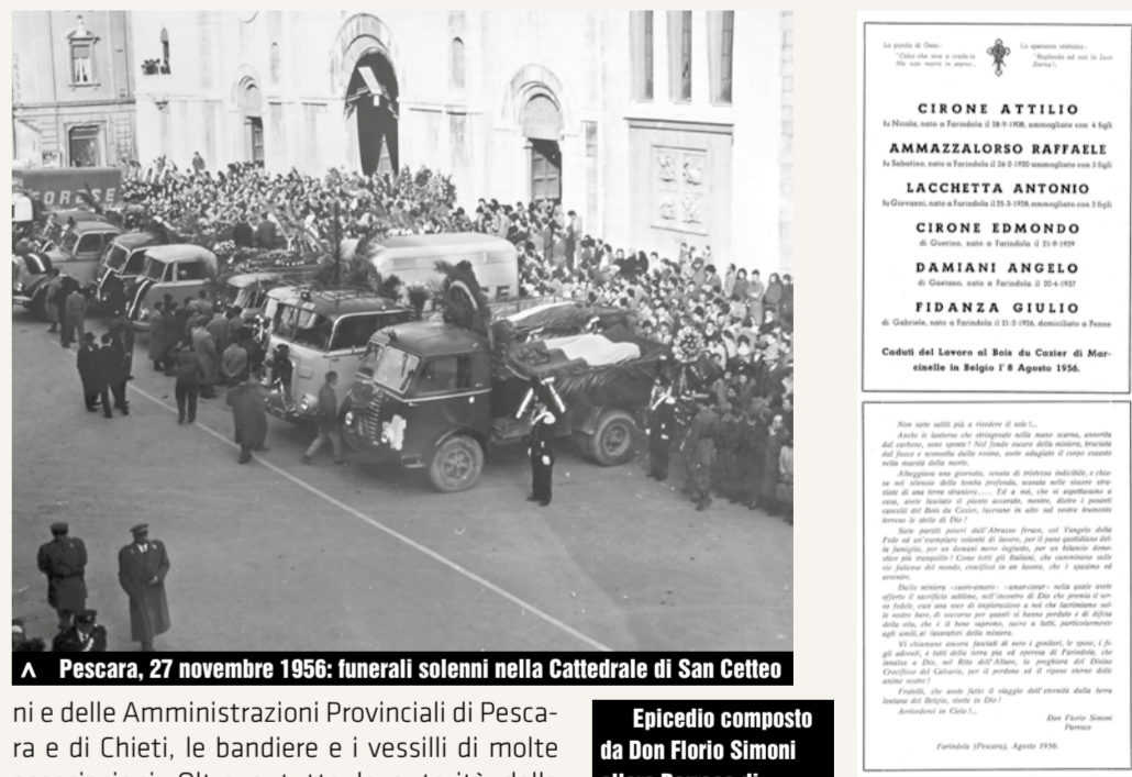
Pescara, 27 novembre 1956: funerali solenni nella Cattedrale di San Cetto

ni e delle Amministrazioni Provinciali di Pescara e di Chieti, le bandiere e i vessilli di molte associazioni. Oltre a tutte le autorità della Provincia di Pescara e di quella di Chieti, figuravano molti operai e numerose maestranze in tutta, lavoratori dell'artigianato e della agricoltura, donne lavoratrici, intellettuali, funzionari e dipendenti di ogni attività e di ogni ceto sociale. Tutto l'Abruzzo ha voluto rendere onore alle spoglie di chi è caduto sul lavoro.