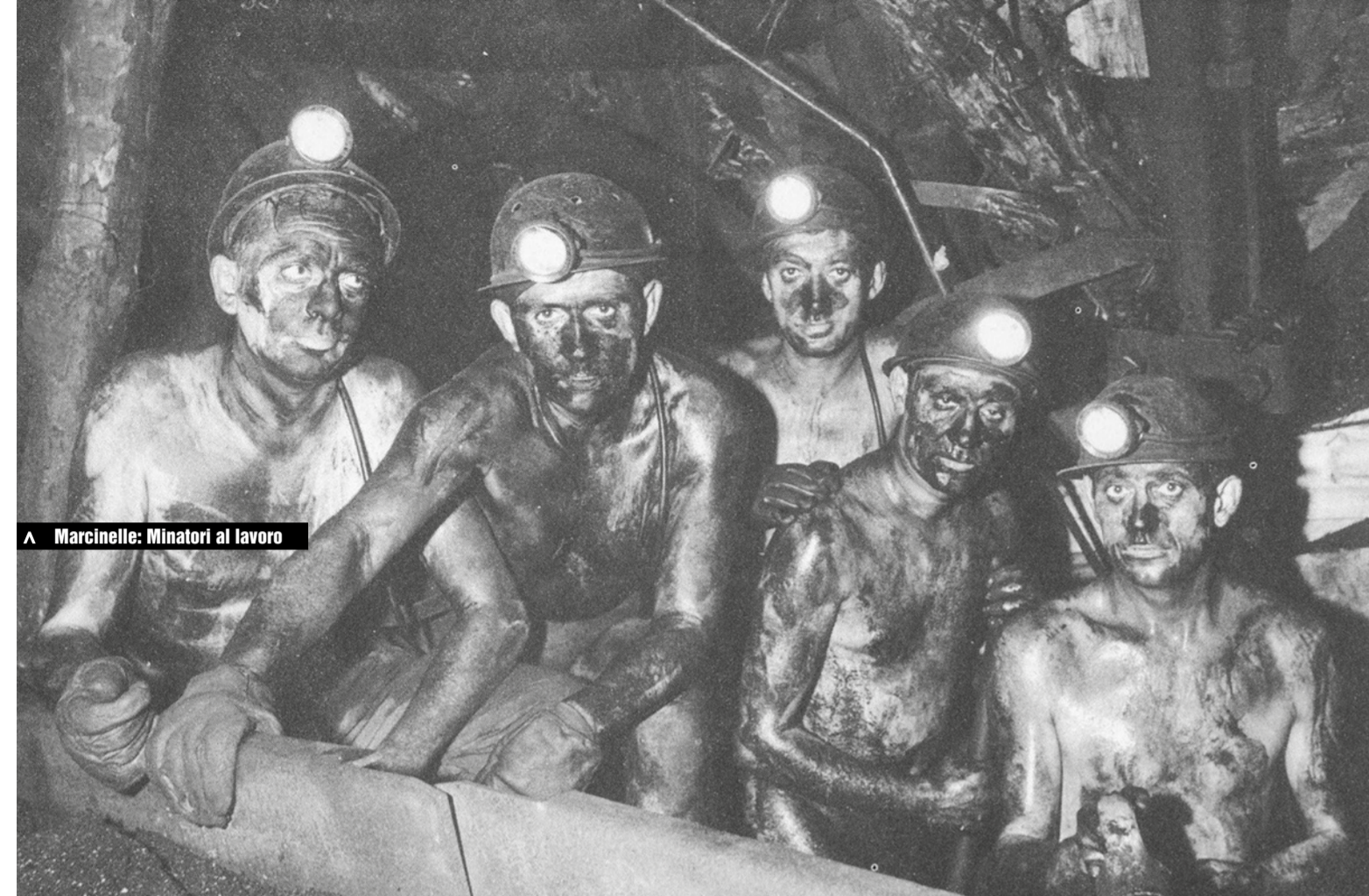
FARINDOLA E PENNE Una ferita ancora aperta per sei vittime della miniera