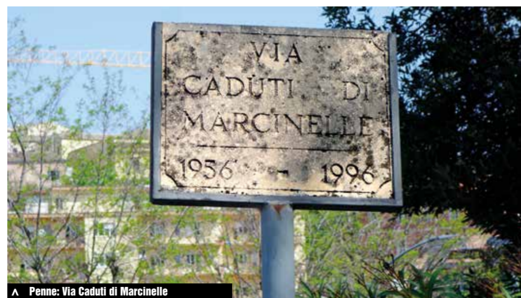
Penne: Via Caduti di Marcinelle