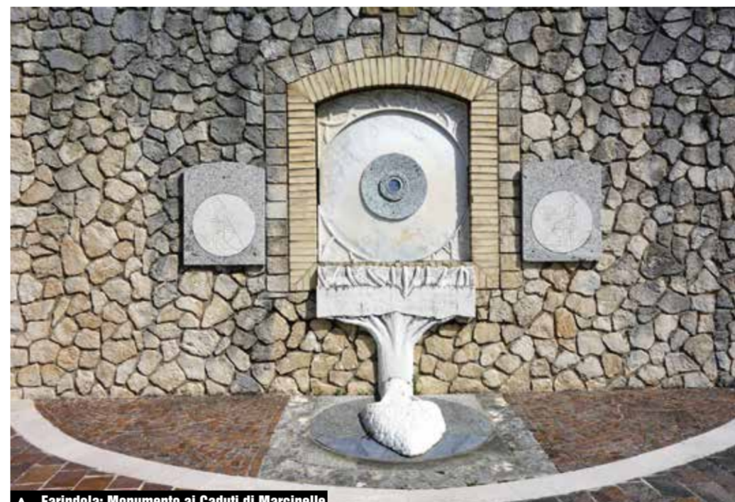
Farindola: Monumento ai Caduti di Marcinelle