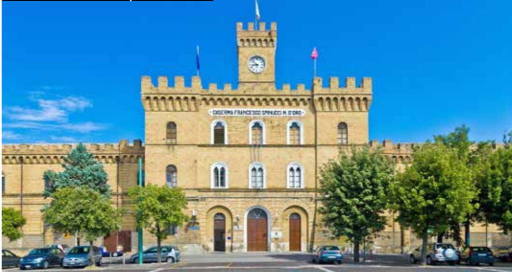
▲ La caserma Francesco Spinucci a Chieti