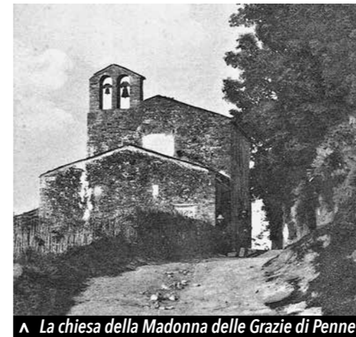
▲ La chiesa della Madonna delle Grazie di Penne

ne solo del grano e degli altri cereali tutti, ma del mosto altresì, della frutta, delle olive, e delle ghiande, l'anno 1816 ebbe fine in mezzo ai nostri più neri presentimenti.