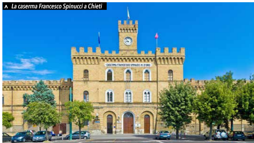
▲ La caserma Francesco Spinucci a Chieti