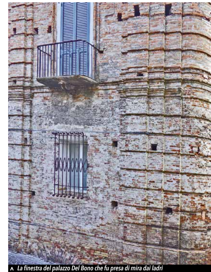
La finestra del palazzo Del Bono che fu presa di mira dai ladri

10. Libbre tre di lana tinta nera, e filata, ri-