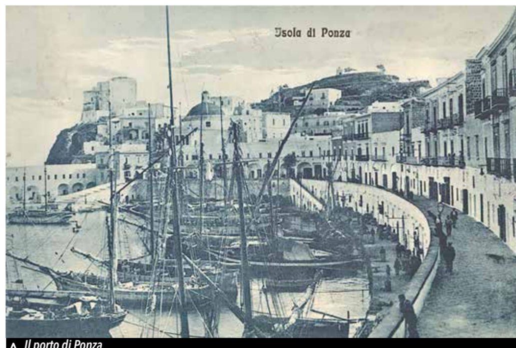
Il porto di Ponza

Alla Spedizione di Sapri, perché "arruolati", presero parte altri abruzzesi, i quali, meritevoli o no, in alcuni casi sono stati ricordati nei relativi comuni di nascita, come ad esempio il Parco Vitantonio de Luca a Cerratina di Pianella.