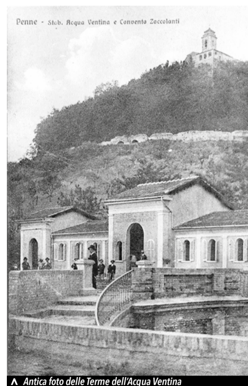
▲ Antica foto delle Terme dell'Acqua Ventina